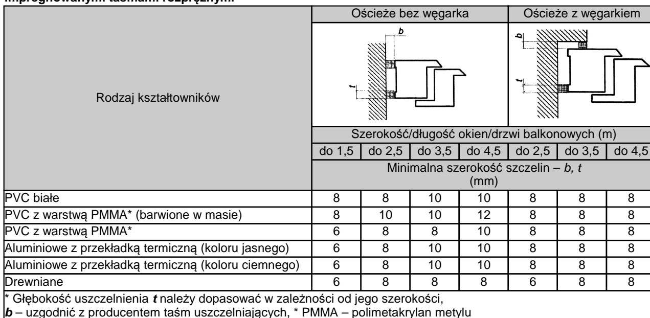
Tablica 4. Minimalna szerokość szczelin między ramą ościeżnicy a ościeżem przy uszczelnieniach impregnowanymi taśmami rozprężnymi*

Maksymalny wymiar szczeliny między ościeżnicą okienną a ościeżem nie powinien przekraczać 40 mm. Przy stosowaniu pianek jednoskładnikowych wymiar ten powinien wynosić maksymalnie 30 mm.